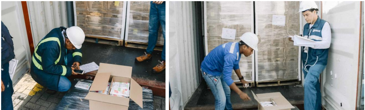
Puerto Cartagena - Colombia - Contecar. Revisión DIAN e INVIMA.